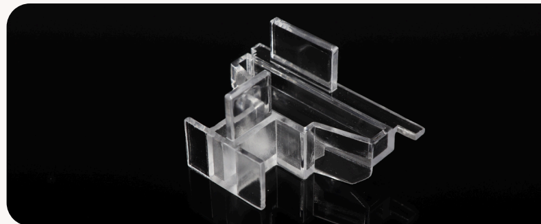
Démonstrateur visuel, impression 3D résine